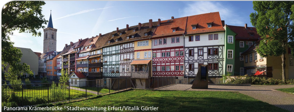
Panorama Krämerbrücke

Kreisverband Steglitz-Zehlendorf Kreisverband Treptow-Köpenick