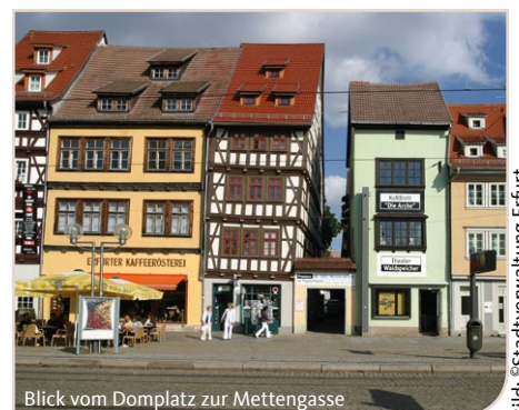
Blick vom Domplatz zur Mettengasse